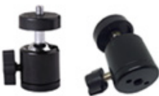
Rótula de bola