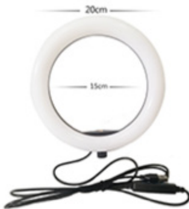
Anel de luz LED